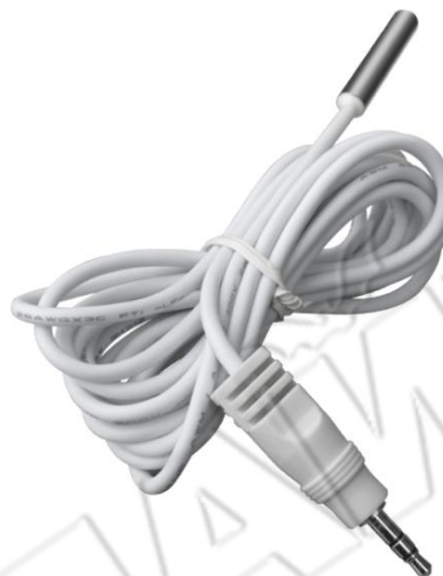
Датчик температуры (1 шт.)