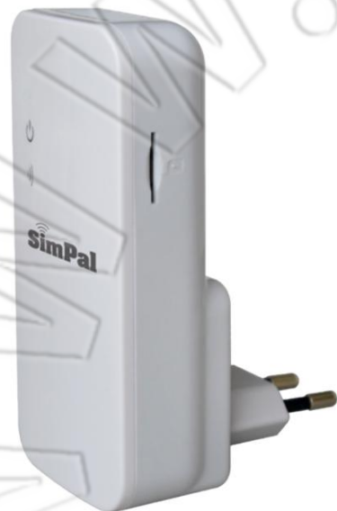
Извещатель (1 шт.)