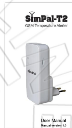
Руководство пользователя (1 шт.)